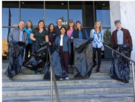
City of Wenatchee Clean-up Team on Earth Day

The City's Code Enforcement team , within the Community Development Department , is made up of passionate individuals who ensure our city is safe, clean and address issues through proactive education and enforcement. The Code Enforcement team is responsible for pursuing city code violations through enforcement tools such as abatements. An abatement case begins when the city opens a city code violation case and sends a courtesy letter which details the violation(s), corrections and a time frame to comply. If the owner does not comply, the matter is heard at the Code Enforcement Board which may assess daily fines for up to 30 days or until complied. If the property remains out of compliance after the 30 days the case will be sent to the City's Attorney to obtain a Court Order to abate the property and collect fines and abatement costs from the owner. The Code Enforcement team has successfully abated several problem properties this past year including abatement of a property where over 38 cars were removed.