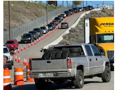
Cars line up to participate at the City's recycling event

The City's Code Enforcement team , within the Community Development Department , is made up of passionate individuals who ensure our city is safe, clean and address issues through proactive education and enforcement. The Code Enforcement team is responsible for pursuing city code violations through enforcement tools such as abatements. An abatement case begins when the city opens a city code violation case and sends a courtesy letter which details the violation(s), corrections and a time frame to comply. If the owner does not comply, the matter is heard at the Code Enforcement Board which may assess daily fines for up to 30 days or until complied. If the property remains out of compliance after the 30 days the case will be sent to the City's Attorney to obtain a Court Order to abate the property and collect fines and abatement costs from the owner. The Code Enforcement team has successfully abated several problem properties this past year including abatement of a property where over 38 cars were removed.