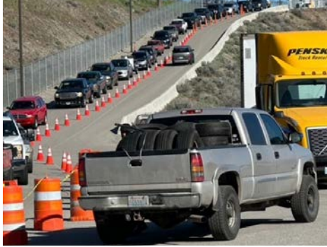
Autos hacen fila para participar en el evento de reciclaje de la Ciudad

El equipo de Aplicación del Código dentro del Desarrollo Comunitario está formado por personas apasionadas que garantizan que nuestra ciudad sea segura, limpia y abordan los problemas mediante la educación y el cumplimiento proactivos. Estos empleados son responsables de perseguir las violaciones del código de la ciudad a través de aplicación de la ley, como las reducciones. Un caso de reducción comienza cuando la ciudad abre un caso de violación del código de la ciudad y envía una carta de cortesía que detalla las violaciones, las correcciones y el plazo para cumplir. Si el propietario no cumple, el asunto se escucha ante la Junta de Cumplimiento del Código, que puede imponer multas diarias por hasta 30 días o hasta que se cumpla. Si la propiedad sigue sin cumplir después de los 30 días, el caso se enviará al Fiscal de la Ciudad para obtener una orden judicial para reducir la propiedad y cobrar multas y costos de reducción al propietario. Los funcionarios encargados de hacer cumplir el código han solucionado con éxito varias propiedades problemáticas el año pasado, incluida la eliminación de una propiedad donde se retiraron más de 38 automóviles.