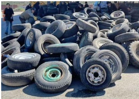
Se recogieron y retiraron un total de 24,02 toneladas de neumáticos de la ciudad de Wenatchee en el evento de reciclaje del 20 de abril.

El equipo de Desarrollo Comunitario también ayudó a organizar un evento anual de reciclaje para los residentes de la ciudad que eliminó un total de 24 toneladas de neumáticos, 63 baterías de automóviles y llenó dos contenedores de basura de 60 yardas con productos electrónicos. A pequeña pero gran escala, los empleados también organizaron una limpieza del Día de la Tierra y recogieron casi 140 libras de basura en toda la ciudad. Todos estos esfuerzos suman y contribuyen a una comunidad saludable.