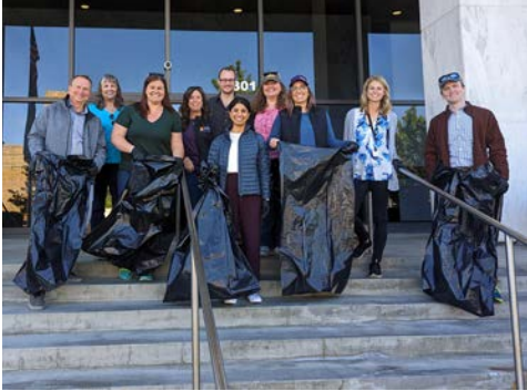
Equipo de limpieza de la ciudad de Wenatchee en el Día de la Tierra

El equipo de Aplicación del Código dentro del Desarrollo Comunitario está formado por personas apasionadas que garantizan que nuestra ciudad sea segura, limpia y abordan los problemas mediante la educación y el cumplimiento proactivos. Estos empleados son responsables de perseguir las violaciones del código de la ciudad a través de aplicación de la ley, como las reducciones. Un caso de reducción comienza cuando la ciudad abre un caso de violación del código de la ciudad y envía una carta de cortesía que detalla las violaciones, las correcciones y el plazo para cumplir. Si el propietario no cumple, el asunto se escucha ante la Junta de Cumplimiento del Código, que puede imponer multas diarias por hasta 30 días o hasta que se cumpla. Si la propiedad sigue sin cumplir después de los 30 días, el caso se enviará al Fiscal de la Ciudad para obtener una orden judicial para reducir la propiedad y cobrar multas y costos de reducción al propietario. Los funcionarios encargados de hacer cumplir el código han solucionado con éxito varias propiedades problemáticas el año pasado, incluida la eliminación de una propiedad donde se retiraron más de 38 automóviles.