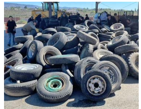
A total of 24.02 tons of tires were collected and removed from the City of Wenatchee at the recycling event on April 20th

The Community Development team also helped organize an annual recycle event for city residents which removed a total of 24 tons of tires, 63 car-type batteries and filled two 60-yard dumpsters with electronics. On a small, but mighty scale, City employees also organized an Earth Day cleanup and collected nearly 140 pounds of trash around the city. All of these efforts add up and contribute to a healthy community.