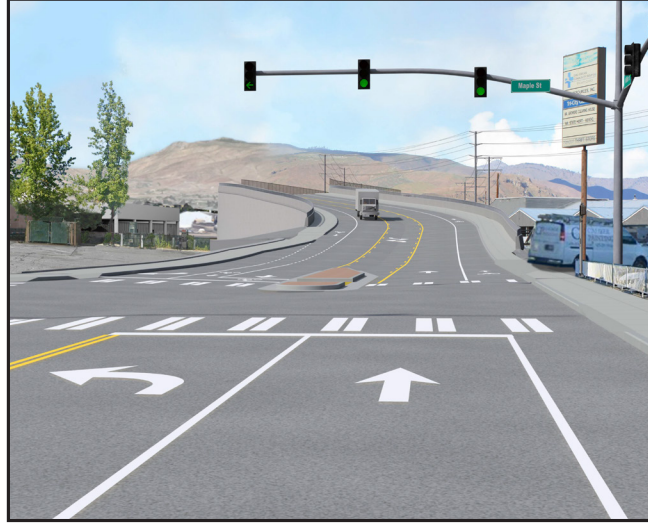
Vista de la calle mirando hacia el norte desde la intersección de Maple St y N Miller St del paso elevado de Confluence Parkway del ferrocarril BNSF