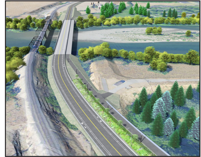
Mirando hacia el norte la nueva conexión de carretera, puente y sendero sobre el río Wenatchee