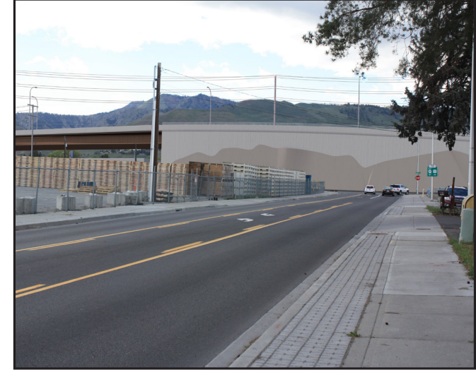
Vista de la calle mirando hacia el oeste por Walla Walla Ave en el nuevo paso elevado de Confluence Parkway del ferrocarril BNSF