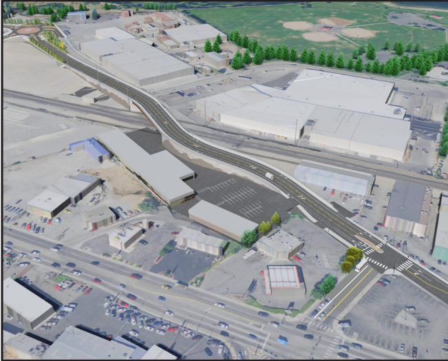
Mirando hacia el noreste, el nuevo paso elevado de Confluence Parkway, el parque Walla Walla Point y las mejoras de las carreteras circundantes

(Conexiones de Río y Ferrocarril - Ilustración de Diseño Preliminar, Julio de 2024)