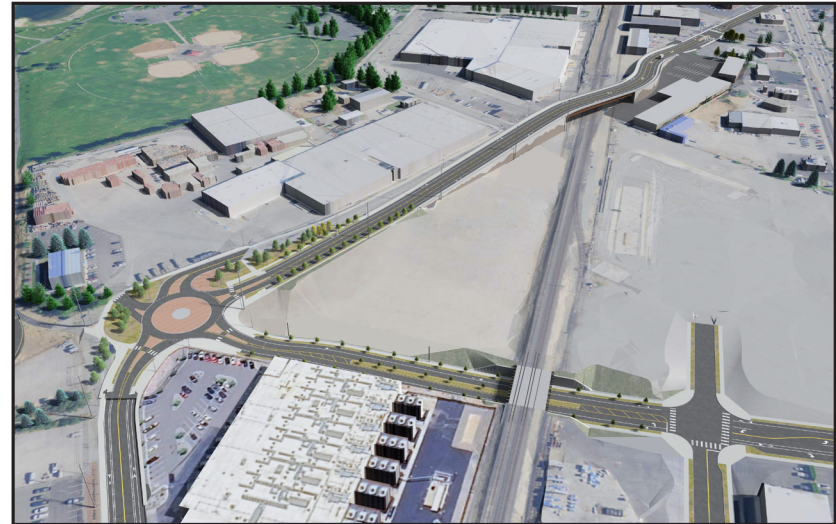
Mirando hacia el sureste, los nuevos puentes que separan McKittrick St y Confluence Parkway del ferrocarril BNSF