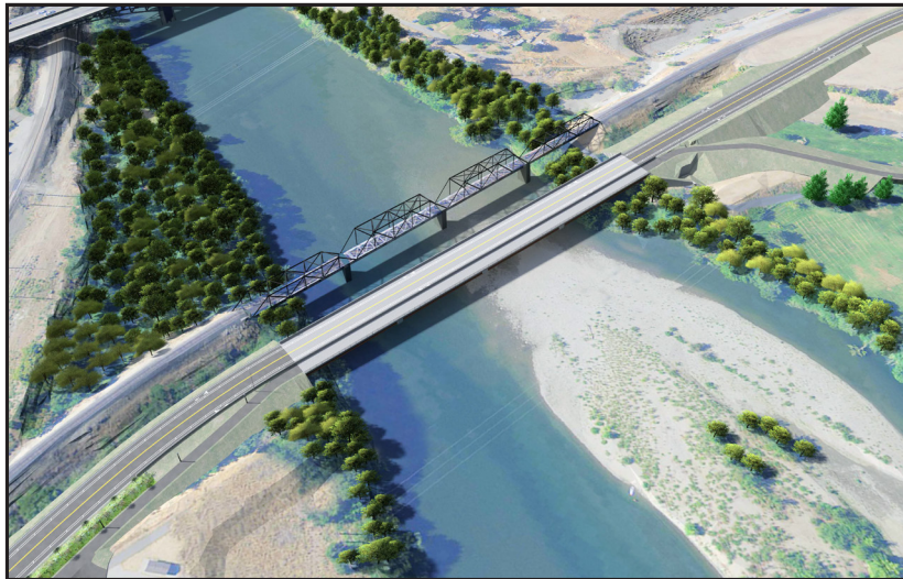
Mirando hacia el noreste, el nuevo puente y la conexión del sendero sobre el río Wenatchee