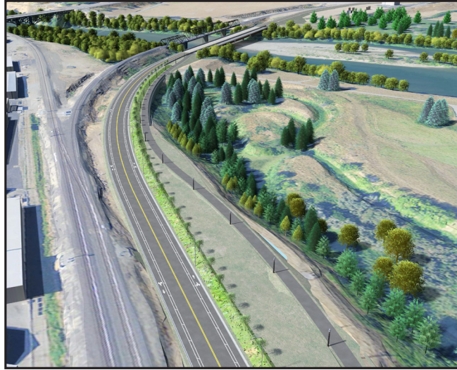
Mirando hacia el noreste, la nueva conexión de carretera, puente y sendero sobre el río Wenatchee