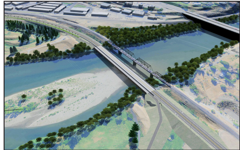
Mirando hacia el suroeste, el nuevo puente y la conexión de sendero sobre el río Wenatchee